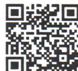
ระบบ e-learning สำหรับการลงทะเบียนของนายทะเบียน