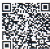
สิ่งที่ส่งมาด้วย ๑