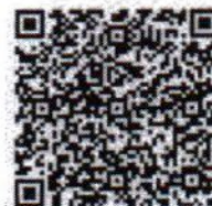
QR Code รายละเอียดหลักสูตรฯ