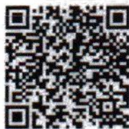
QR Code ใบสมัคร

กองส่งเสริมสิทธิและเสรีภาพ สถาบันพัฒนาสิทธิมนุษยชน โทร. ๐ ๒๑๔๑ ๒๗๕๐