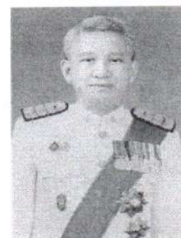
๑๐. นายยุทธพงษ์ อภิรัตน์รังษี อธิบดีอัยการ สำนักงานคดีทรัพย์สินทางปัญญา และการค้าระหว่างประเทศ สำนักงานอัยการสูงสุด