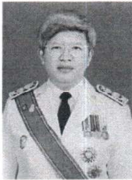
๕. นางสาวรีนวดี สุวรรณมงคล อดีตอธิบดีกรมคุมประพฤติ และอดีตอธิบดีกรมบังคับคดี