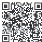
Line @ งานสัมมนา