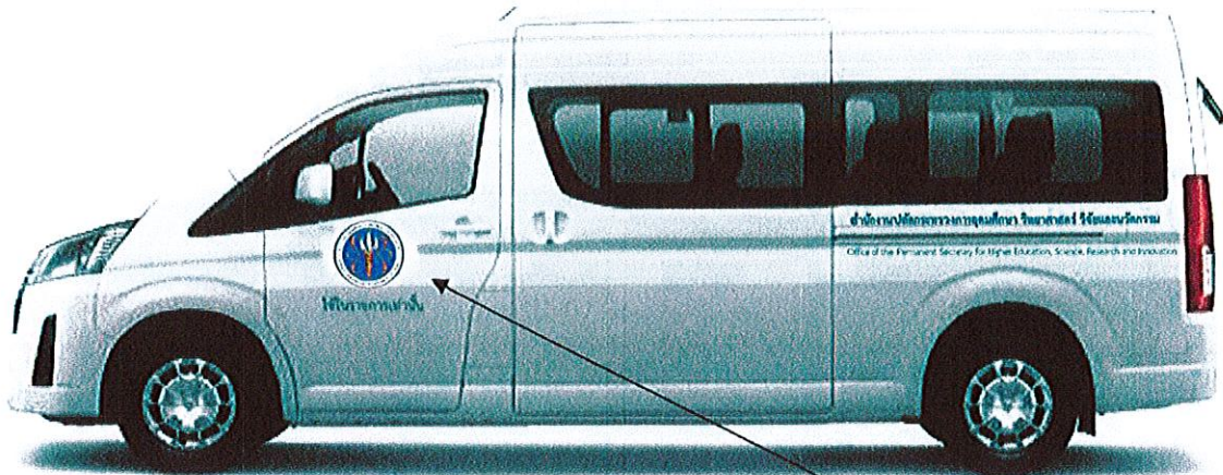
ด้านซ้าย