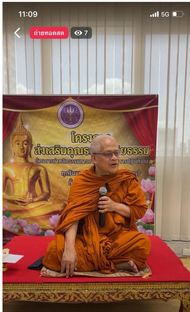
การเข้าร่วมโครงการ “การฟังธรรม ทำบุญ ประจำวันพุธ” ของบุคลากร (กสค.) ผ่านช่องทางออนไลน์ Facebook Live : กลุ่มงาน จริยธรรม อว.