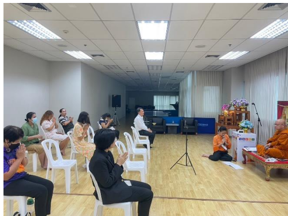
การเข้าร่วมโครงการ “การฟังธรรม ทำบุญ ประจำวันพุธ” ของบุคลากร (กสค.) ณ ชั้น ๑๑ อาคารอุดมศึกษา ๒ สป.อว. (ศรีอยุธยา)