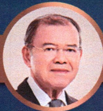
Dr. Supachai Panitchpakdi

Former Secretary-General of UNCTAD and Former Director-General of the World Trade Organization (WTO)