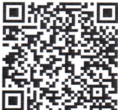
QR Code วิธีการลงทะเบียน และการรับสมัคร