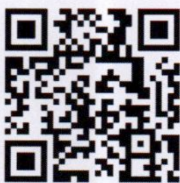
QR Code เข้าชมงานผังเมืองโลก ผ่านทาง Facebook