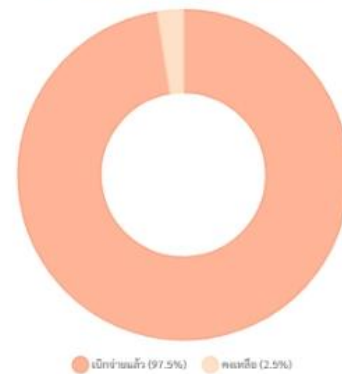
ภาพที่ 4 ระบบแดชบอร์ดที่เขียน script โดย Cluade

ทั้งนี้ สามารถดาวน์โหลดได้ทาง link : https://bit.ly/45498ud