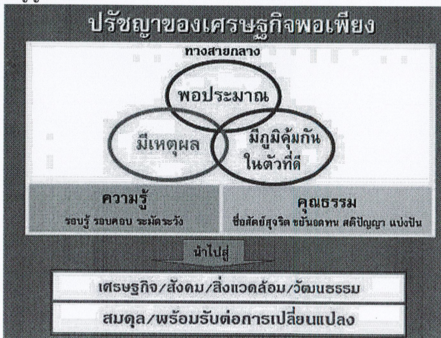
ภาพ หลักปรัชญาของเศรษฐกิจพอเพียง

โดยหลักปรัชญาของเศรษฐกิจพอเพียง คือ ปรัชญาที่ชี้ถึงแนวการดำรงอยู่และปฏิบัติตนของประชาชนในทุกระดับ ตั้งแต่ระดับครอบครัว ระดับชุมชน จนถึงระดับรัฐทั้งในการพัฒนาและบริหารประเทศ ให้ดำเนินไปในทางสายกลาง โดยเฉพาะการพัฒนาเศรษฐกิจให้ก้าวทันต่อยุคโลกาภิวัตน์ โดยการพัฒนาตามหลักเศรษฐกิจพอเพียง คือ การพัฒนาที่ตั้งอยู่บนพื้นฐานของทางสายกลาง และความไม่ประมาท โดยคำนึงถึง ความพอประมาณ ความมีเหตุผล การสร้างภูมิคุ้มกันที่ดีในตัว ตลอดจนใช้ความรู้ความรอบคอบ และคุณธรรมประกอบการวางแผน การตัดสินใจและการกระทำ ทั้งนี้ การนำเศรษฐกิจพอเพียงไปประยุกต์ใช้ ต้องคำนึงถึง ๔ มิติ ได้แก่ ด้านเศรษฐกิจ เช่น ลดรายจ่าย เพิ่มรายได้ ใช้ชีวิตอย่างพอควร มีภูมิคุ้มกัน เป็นต้น ด้านสังคม เช่น ช่วยเหลือเกื้อกูล สร้างความเข้มแข็งให้ครอบครัวและชุมชน เป็นต้น ด้านทรัพยากรธรรมชาติและสิ่งแวดล้อม โดยการรู้จักใช้และจัดการอย่างฉลาดและรอบคอบเลือกใช้ทรัพยากรที่มีอยู่อย่างรู้ค่าและเกิดประโยชน์สูงสุด รวมถึงฟื้นฟูทรัพยากรเพื่อให้เกิดความยั่งยืนสูงสุด และด้านวัฒนธรรม โดยการเห็นประโยชน์และคุณค่าของภูมิปัญญาไทย ภูมิปัญญาท้องถิ่น