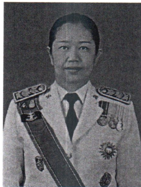
๗. นางภัทรา โชว์ศรี รองผู้ว่าการตรวจเงินแผ่นดิน