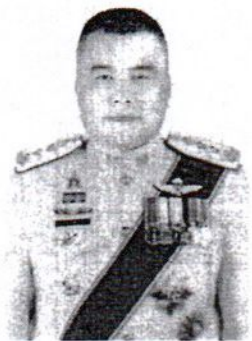
๓๓. พลตำรวจโท สาโรช นิมเจริญ อดีตผู้บัญชาการสำนักงานตรวจสอบภายใน สำนักงานตำรวจแห่งชาติ