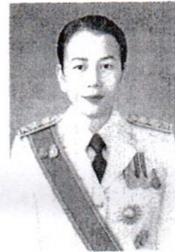
๑๔. นางพรพิมล นิลทจันทร์ รองเลขาธิการสำนักงานศาลรัฐธรรมนูญ และอดีตนักตรวจสอบภายใน สำนักตรวจสอบภายใน มหาวิทยาลัยธรรมศาสตร์