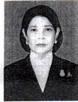
๒. นางสาวพศุทธิ์มณีชา จำปาเทศ อดีตรองผู้ว่าการตรวจเงินแผ่นดิน