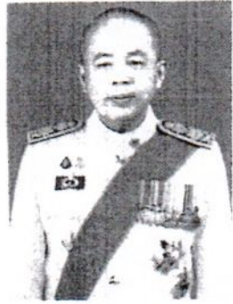
๑๑. นายธัญญา เนติธรรมกุล อดีตรองปลัดกระทรวงทรัพยากรธรรมชาติและสิ่งแวดล้อม