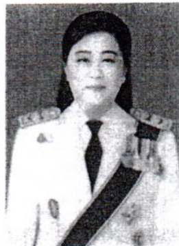
๒๘. นางดวงตา ตันโซ อดีตเลขาธิการราชบัณฑิตยสภา