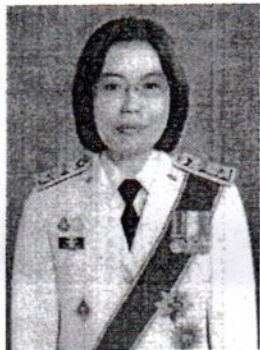
๑๓. นางสาวอัชชลี เจริญทรัพย์ อดีตรองผู้ว่าการตรวจเงินแผ่นดิน