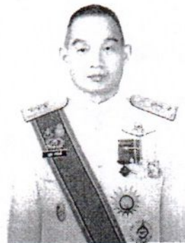
๑๐. พลโท นุกูล นรฉัตร ผู้อำนวยการศูนย์ประสานการปฏิบัติที่ ๑ สำนักงานปฏิบัติการกิจรักษาความมั่นคงภายในกองทัพบก