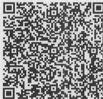
ใบสมัครอธิการบดี เอกสารหมายเลข 1