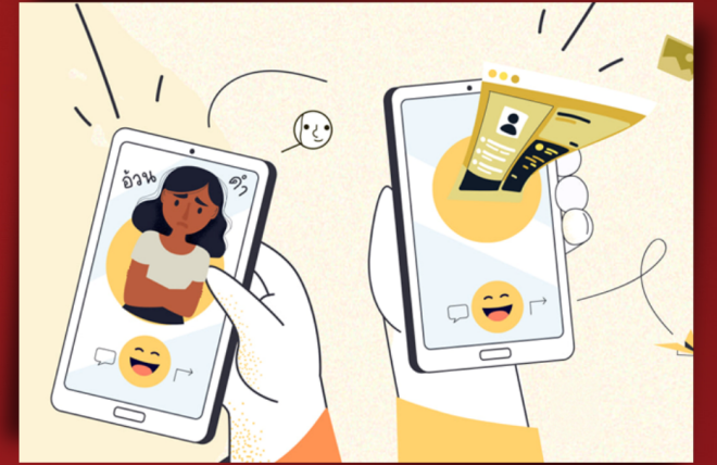
การกลั่นแกล้งทางเพศ