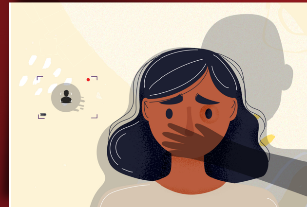
การข่มขู่ทางเพศ